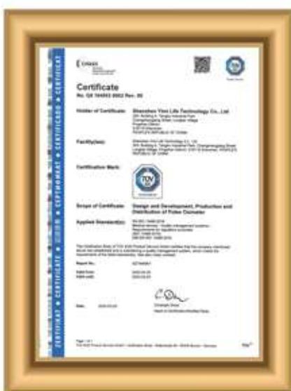
EN ISO 13485:2016